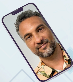
BIRET GRÉGORY ERUN PAPN DGEE

Mon parcours en tant qu'enseignant a été fortement influencé par l'intégration du numérique. Au début, fasciné par les nouvelles technologies, je les ai introduites dans ma classe avec l'enthousiasme d'un "geek". Je voyais le numérique comme un outil magique, mais cette approche initiale manquait de réflexion, de recul et donc d'efficacité pédagogique.